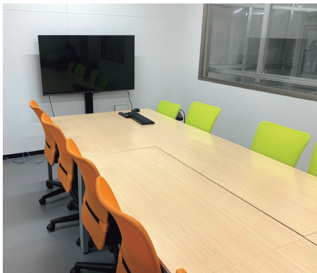
ミーティングルーム