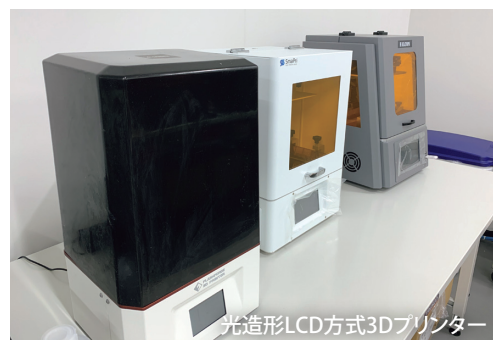
光造形LCD方式3Dプリンター