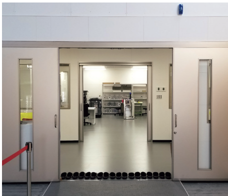
ショールーム入口