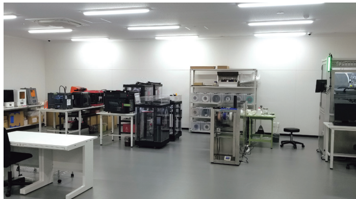
ショールーム内観