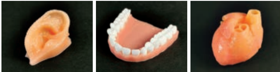
※歯は光造形品です