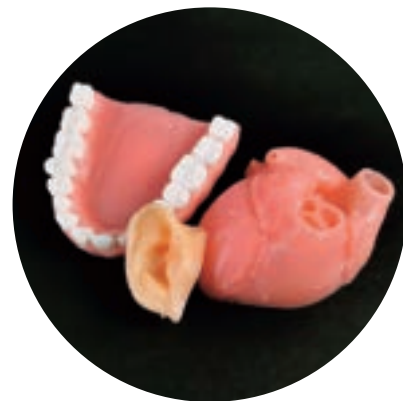
※写真は造形例です。

本製品は特許申請商品です(※特許番号：第7158787号、第7121435号、第6949187号)